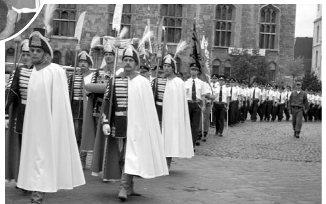
Koronaőrök és esküt tevő rendőr tiszthelyettesek vonulása