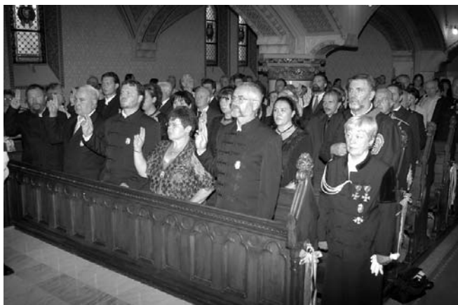
Az eskütétel ünnepi pillanatai

Ezen a – sokunk számára történelmi – napon 29 avatandó vitézi eskütételére került sor.