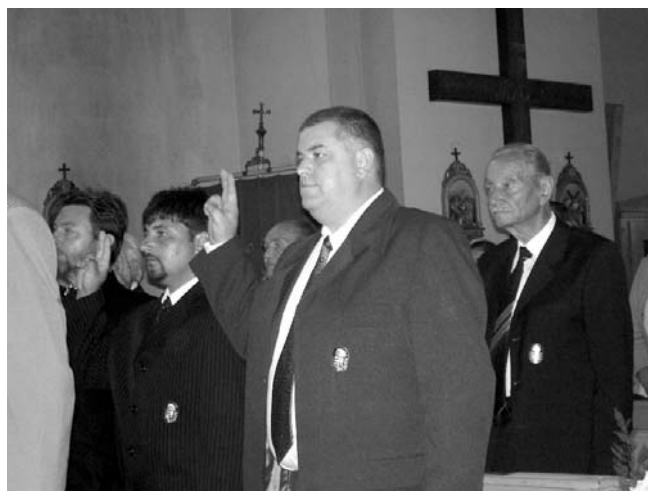
Eskütevő doni bajtársak és várományosok