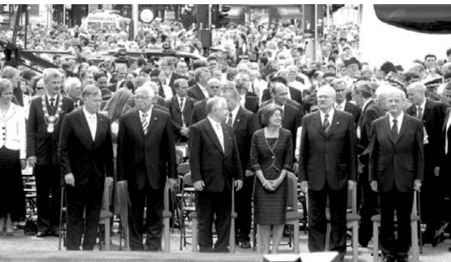
Öt állam vezetői között díszvendég Sólyom László köztársasági elnök

vitéz Hajdú Szabolcs törzskapitány '56-os közlegény