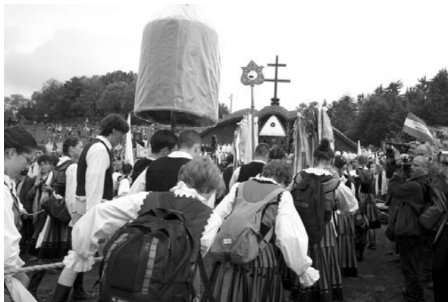
Csíkszeredai diákok a kisbazilikával (babarum)

Ha pünkösdkor ránézünk a Kissomlyóra – élő korona-hoz hasonlatos a hegy! Lehet, hogy egy adott pillanatban nem teljes a körkoszorú, de az ünnep alatt a hívek talpai mégis megrajzolják e fenséges természeti korona alapvonalát. – S e lélekkoronának a csüngői az otthonukba visszatérő zarándoklók, a búcsújárás útjai.