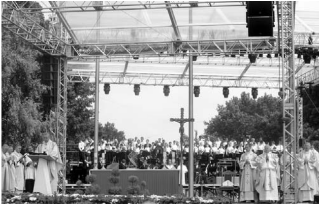
A papság részvétele az ünnepségen