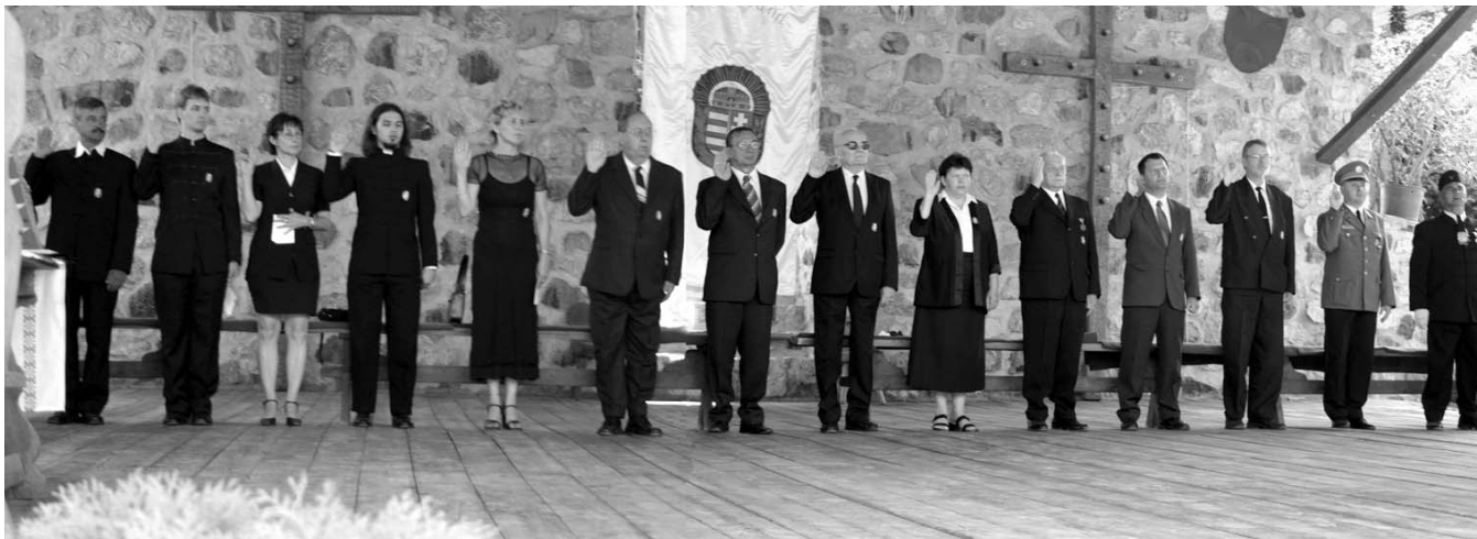
Az eskütétel ünnepi pillanatai