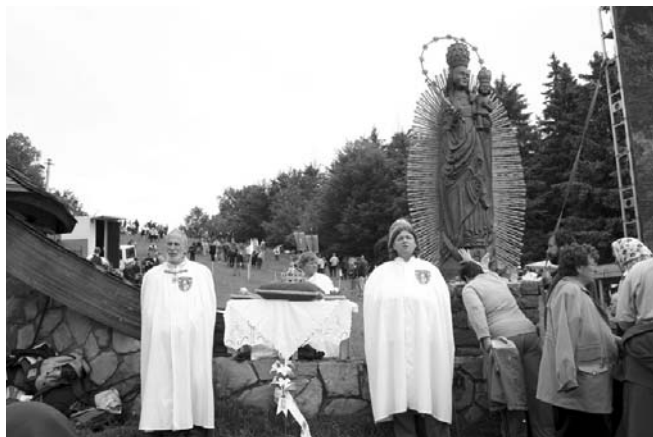
A Szent Korona (másolata); Magyarok Nagyasszonya Szent Korona Lovagrend

A csíksomlyói búcsú a székelysége és a csángósága. Amikor sorra megérkeznek a keresztalja közösségek, a hagyományaik alapján mondhatjuk, Szent László mitikus hadi-népe vonul fel, sőt, Szent László keresztfitai, hiszen a csángó nevet ő adta csengős lovú követőinek, a monda szerint.