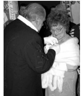
v. Molnár Piroska, dr. Juhartosné