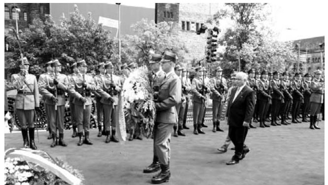
A lengyel államfő koszorúz