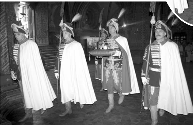
A Szent Korona indulása a Mátyás templomból