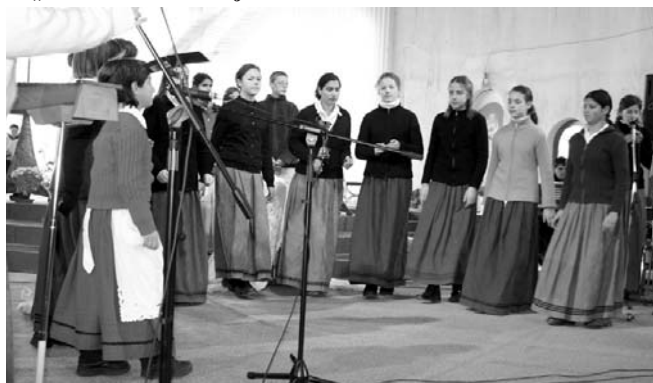
Az „Árvácskák” koncertje