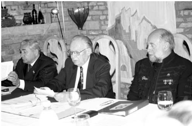
A rendi kérdések egyeztetése