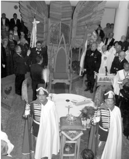
Millennium Templom, Csíkszereda

A csíksomlyói búcsút követő nap az ideje immár hagyományosan – Erdélyben a vitéz-avatásnak. Jelképes az