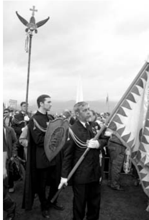
A Történelmi Vitézi Rend képviselőinek érkezése