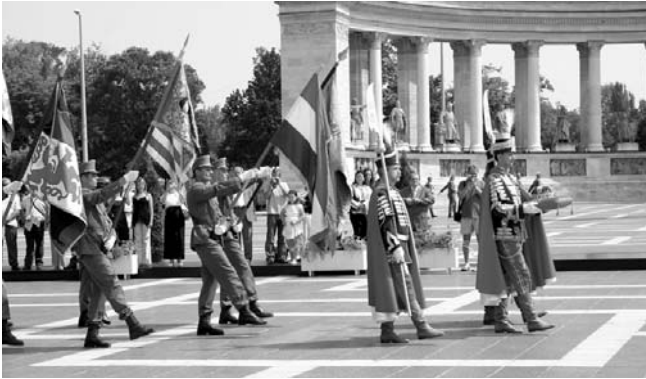
A Szent Korona bevonulása a Hősök terén