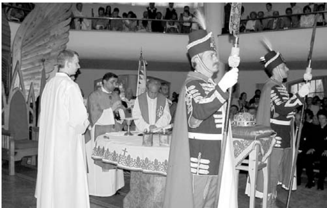
A Szent Korona (másolata) és a koronaőrök