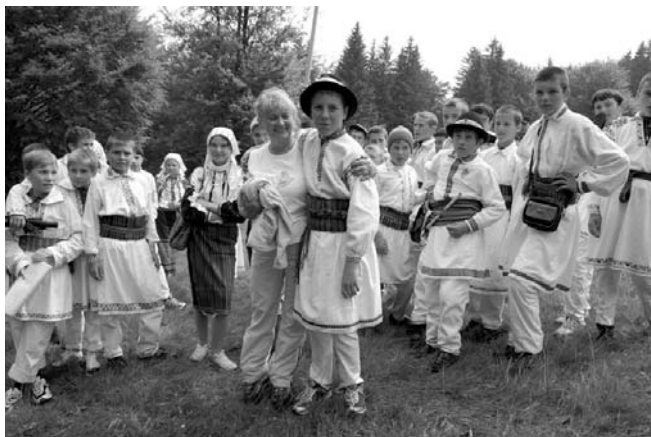
Csángó fiatalok karéjában

A csíksomlyói búcsú – katolikus, hiszen Jézus Krisztus katolikus, azaz egyetemes egyházának tagjai jönnek el ide. Ez a búcsú az istenember Jézushoz való hűségének élő jele. E hűségnek a diadalát hozta 1567-ben a Tolvajos-tetői csata, midőn ott az új ariánus hadakat legyőzték a gyergyói, síki székelyek. A Szentháromság Egyisten népe üli Somlyón hálaadó ünnepét.