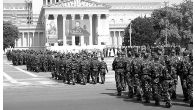
Az esküt tevők bevonulása