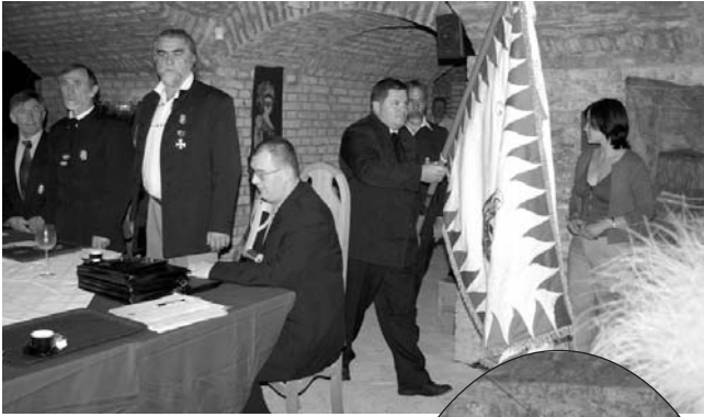
A zászló bevonulása