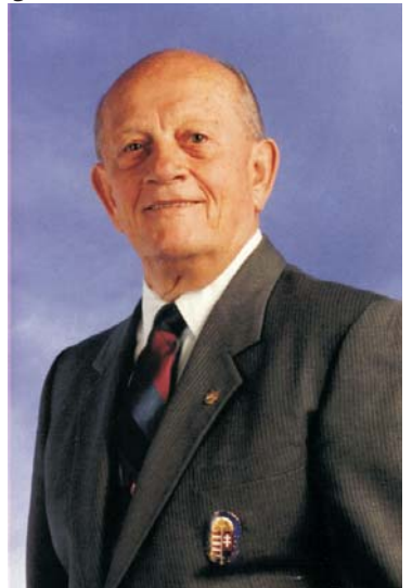
Vitéz Detre Gyula László, Kanada tb. törzskapitánya

geik és nem „baráti szövetségesek” voltunk – DE – akik már akkor a kommunizmus ellen harcoltunk. Nem voltunk népszerűek – és amíg jobban meg nem ismertek bennünket, ellenséggként kezelték. Ezek a szomorú gondolatok jutnak eszembe azokról az időkről, amikor a keresztény Európa élet-halál harcát vívta (– és sajnos vívja még ma is!). A II. világháború hősei, mártírjai és 1956 szabadságharcának hősei a becsületnek, a kötelesség-teljesítésnek és az önfeláldozásnak útját mutatják az Új Év kezdetén, melyről nemzeti egységünk érdekében letérnünk tilos. Mert ez az út az életrevaló népek egyedüli útja. Hajtsuk meg kegyelettel a hálaadás zászlaját a hazát biztosító Honegyesítő Árpád nagyfejedelem emléke és az ezeregyszáz év hősei, mártírjai előtt. – Aki a múltba néz – a jövőbe lát! – Adjon Isten a világ bármely részén élő minden magyarnak áldott, békés új esztendőt, hitet, erős akaratot és összefogást sorsunk jobbra fordítása érdekében.