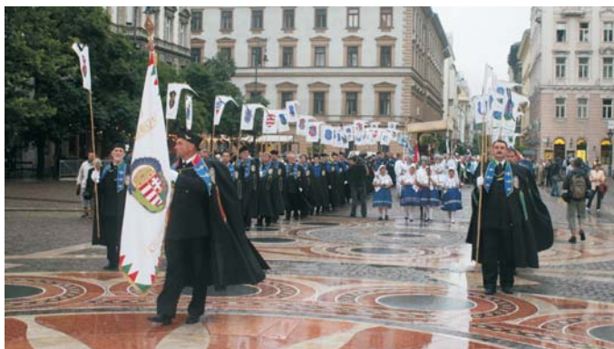
A Fekete Madonna érkezése Budapestre. Hívók ezreinek hálaímaja mellett, lovagrendek ünnepi díszkíséretével.

A Történelmi Vitézi Rend több társ-lovagrenddel együtt fogadta, s adta méltó kíséretét a kegyképnek.