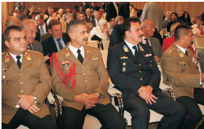
A 20 éves évfordulón, Budai Vár, Széchényi Könyvtár. Az ünnep meghatározó pillanatai