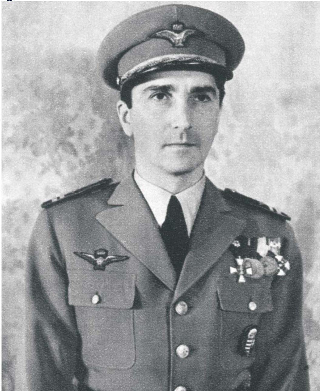
Magyar Szárnyak 1942. február 15.

Pula, 1904. december 9. – Alekszejevka 1942. augusztus 20. Hajnali 5:07' (Héja gépével lezuhant és szörnyethalt.)