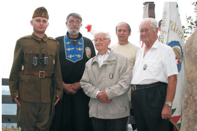
A Bilibók-tetőn 2010-ben rendtársaival

okozott apámnak. Könnyeivel küszködött – igaz, én soha sem láttam sírni életében – és hálából elszavalta Gyóni Géza: 'Csak egy éjszakára küldjétek el őket' című versét. Hihetetlen szellemi frissességgel és energiával szavalt. Úgy gondolom, mindannyiunknak örökös példa lehet hosszú élete, ambíciója és kiváló magyar öntudata. Isten adja Rá áldását és ajándékozza meg hosszú élettel. Neki is ez az egyetlen óhaja.