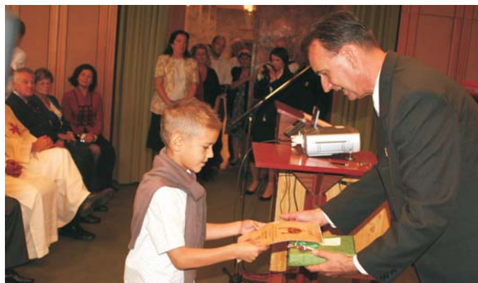
A Szent Korona Gyermekrajz-pályázat egyik díjazottja. Széchényi Könyvtár