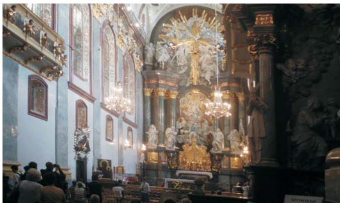
A Fekete Madonna Jasna Góra-i indulása hívek ezrei imája mellett

Csodatévő Madonna – Most is csodát tett! – Kinyilvánította újra két nép történelmi barátságát